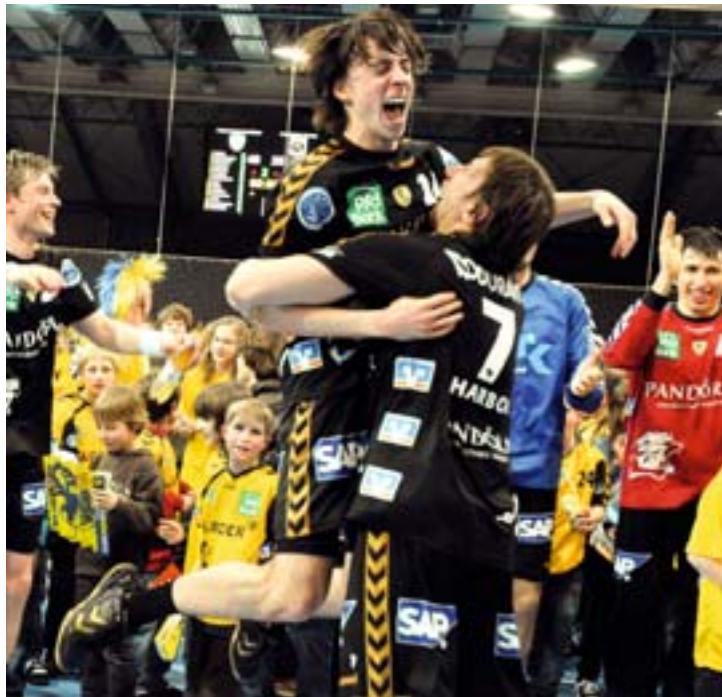
Gefeiert bei Auftritten in Karlsruhe (links), abgesichert durch den erfahrenen tschechischen Rechtsaußen Jan Filip: Patrick Groetzki, privat ein ruhiger und bedachter Typ

Thorsten Storm redet gern über Groetzki. „Patrick“, sagt der Löwen-Manager, „ist ein sehr heller Kopf.“ Er passe gut in das